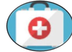
Bekalan First Aid