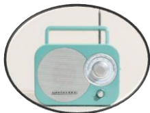
Radio mini (berkuasa bateri)