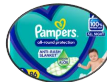
Lampin bayi / dewasa