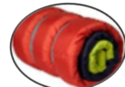
Selimut & beg tidur