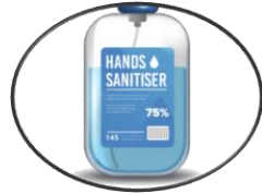
Pembersih tangan & pelitup muka