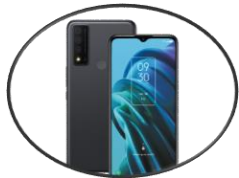
Telefon bimbit & Powerbank

Dalam persediaan untuk kejadian yang tidak dijangka, WOWriors yang tinggal di kawasan berisiko tinggi dinasihatkan untuk menyediakan Beg Kecemasan. Peralatan yang dicadangkan untuk Beg Kecemasan seperti di bawah