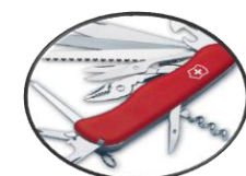
Pisau Tentera Swiss untuk kelangsungan hidup pelbagai tujuan