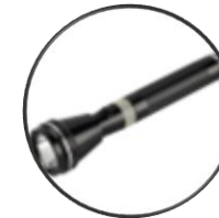
Lampu suluh & Bateri