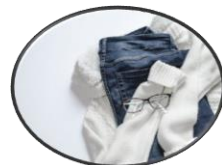
Pakaian & kasut